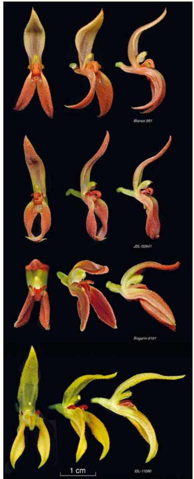
21. Vergleich von Arten der Specklinia-endotrachys -Gruppe – von oben nach unten: Specklinia endotrachys (BLANCO 961), Specklinia spectabilis (JBL-02641), Specklinia remotiflora (BOGARÍN 8181), Specklinia pfavii (JBL-11086); Belege Lankester Bot. Gart.

Danksagung: Wir sind den wissenschaftlichen Dienststellen vom Costa-ricanischen Ministerium für Umwelt und Energie (MINAE) und dem Nationalen System der Schutzgebiete (SINAC) für die Ausstellung der »Wissenschaftlichen Ausweise« sehr dankbar, die es uns ermöglichten, die in der Natur vorkommenden und in dieser Studie behandelten Arten zu sammeln. Wir danken der Vize-Präsidenschaft für Forschung an der Universität Costa Rica für die Unterstützung bei den Projekten 814-BO-052 "Flora Costaricensis: Taxonomía y Filogenia de la subtribu Pleurothallidinae (Orchidaceae) en Costa Rica" and 814-A7-015 "Inventario y taxonomía de la flora epífita de la región Mesoamericana". – Die Redaktion dankt Herrn Dr. Wolfgang RYSY für die Übersetzung aus dem Englischen.