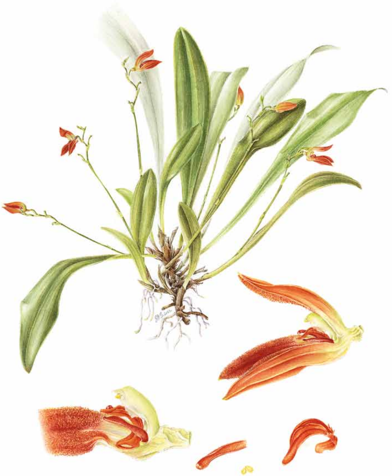
18. Aquarell von Specklinia remotiflora , Typus KARREMANS 4024 (JBL-spirit) 18. Botanical watercolor of Specklinia remotiflora , based on KARREMANS 4024 (JBL-spirit) Illustration: Sylvia Strigari