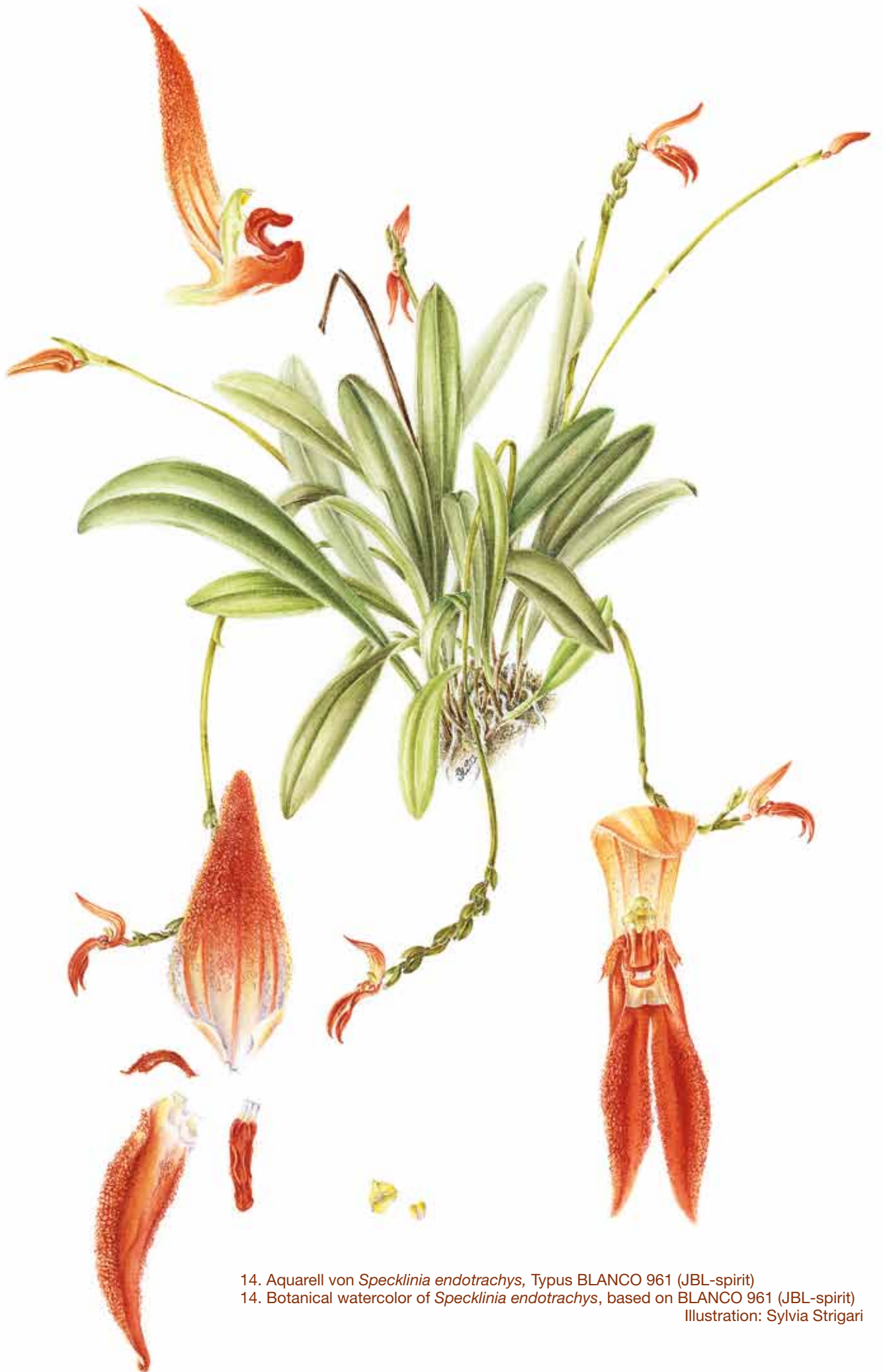
14. Aquarell von Specklinia endotrachys , Typus BLANCO 961 (JBL-spirit) 14. Botanical watercolor of Specklinia endotrachys , based on BLANCO 961 (JBL-spirit) Illustration: Sylvia Strigari