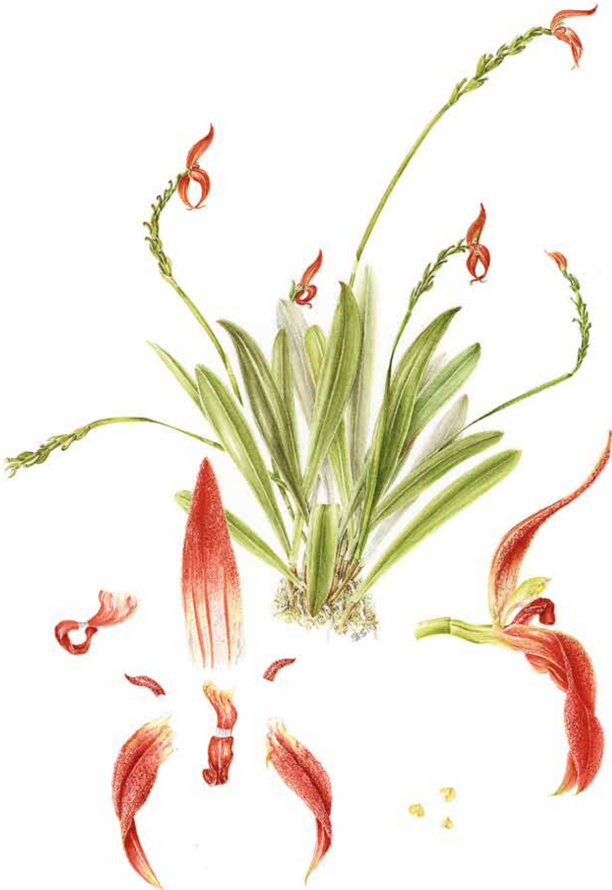
15. Aquarell von Specklinia spectabilis , Typus JBL-02532 (JBL-spirit) 15. Botanical watercolor of Specklinia spectabilis , based on JBL-02532 (JBL-spirit) Illustration: Sylvia Strigari