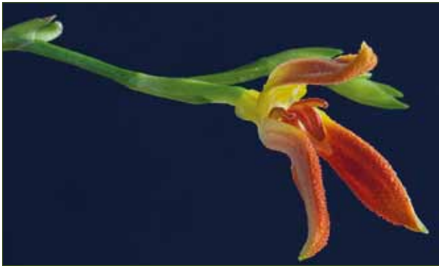
17. Specklinia remotiflora , Holotyp (BOGARÍN 8181), gesammelt in den Berglagen der Talamanca-Gebirgskette in Costa Rica nahe der Grenze zu Panama

17. Specklinia remotiflora , holotype (BOGARÍN 8181), collected in the high mountains of the Talamanca range in Costa Rica, close to the Panamanian border (JBL-spirit)