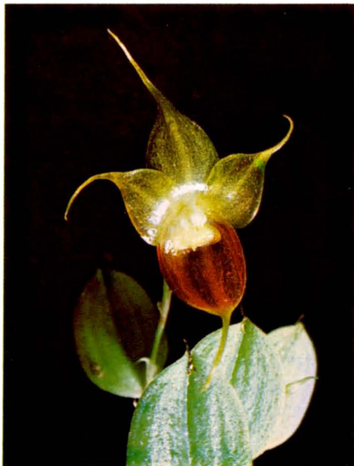
Brachionidium kuhnianum , Dressler sp. nov.

Epífita, rastrera o colgante; rizoma delgado, 6-8 mm entre ramas, cubierto por vainas tubulares, acuminados, blancuzcos; tallos 3-4 mm de largo, cubiertos por brácteas tubulares acuminados; hojas solitarias, pecíolo 1.5-2 mm de largo, lámina anchamente elíptica u ovado-elíptica, con 7 nervaduras cuando seca, 7-12 mm de largo, 7-8.5 mm de ancho, tridentada, el diente intermedio mucho más largo que los laterales; inflorescencia de una flor, 7-16 mm de largo, con 1 o 2 brácteas tubulares, acuminadas, 3-4 mm de largo; bráctea floral anchamente infundibuliforme, acuminada, aprox. 2 mm de largo, con una seta 1.5 mm de largo; flores no resupinadas; ovario con pedicelo aprox. 2 mm de largo; sépalo dorsal elíptico-ovado, lámina 6 mm de largo, 4 mm de ancho, trinervada, cola 5.5 mm largo; lámina del sinsépalo cóncava, orbicular-ovada, 7 mm de largo, 8 mm de ancho, la cola 5 mm de largo, los ápices libres de aprox. 1.5 mm; pétalos oblícuamente ovados, las láminas 5.5 mm de largo, 3 mm de ancho, la cola aprox. 3.5 mm de largo; labelo anchamente obovado, truncado, 2 mm de largo, 3 mm de ancho, abruptamente recurvado, con un callo cóncavo y subdeltoide en la base, apiculado; columna 1.5 mm de largo y ancho; estigma bilobado, cada lóbulo con un diente prominente abajo; polinios: 2 en forma de "U", 1 mm de largo (4 polinios claviformes unidos en pares por los ápices), 2 claviformes más cortos, y 2 rudimentarios.